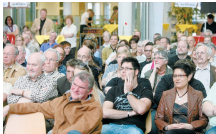
Aufmerksame Zuhörer: In der angenehmen Atmosphäre des Kreishaus-Foyers kam keine Langeweile auf.