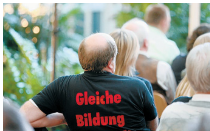
Unterstützung für den Kandidaten: Ein Linken-Sympathisant wirbt auf seinem T-Shirt für gerechtere Bildungschancen für alle.